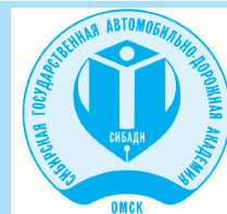
График проведения вузовского фестиваля-конкурса «Студенческая весна СибАДИ-2017»